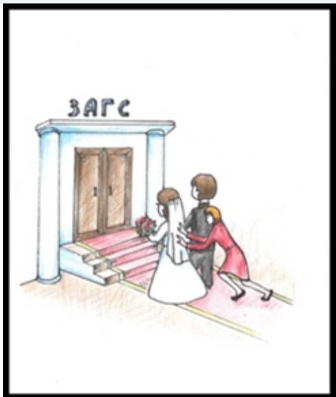
Рис. 3. Что значит не хочу? А ну вперед, а то домой не пушу!

1. На рис.1 представлена регистрация рождения ребенка в органах ЗАГС. Презумпция отцовства. Согласно данной презумпции, которая регулируется нормами СК РФ, отцом ребенка считается лицо, с которым мать ребенка состояла в браке в течение 300 дней до рождения ребенка, состоит в браке на момент рождения ребенка и т.д. Данная презумпция защищает материнство и детство, цельность семьи, благополучное детство ребенка и т.д. Данная презумпция была установлена законодателем с целью защиты прав ребенка, его детства, право воспитываться в семье, общаться с двумя родителями и т.д.